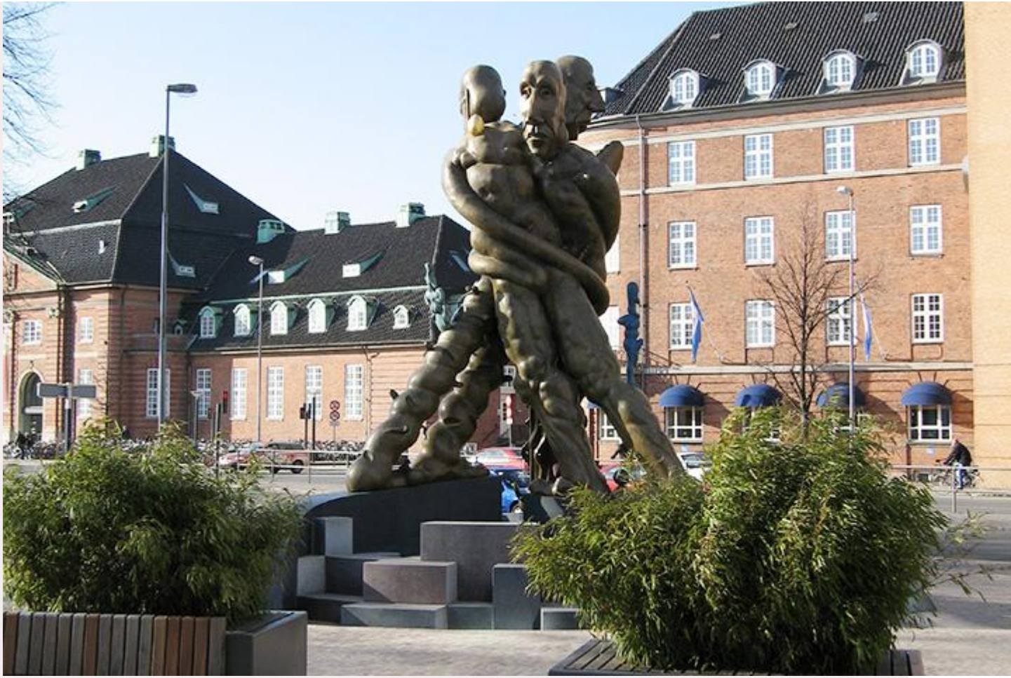
Скульптура Бьёрна Нёргаарда в Оденсе

Напротив вокзала в Оденсе стоит скульптура Бьёрна Нёргаарда «Троица» — три человеческие фигуры, которые закручиваются в спираль. У фигур одинаковые головы с большими носами и маленькими глазами — это Андерсен в трех лицах: Тень, Импровизатор и Дорожный товарищ. «Троица» — первый из многочисленных портретов Андерсена, разбросанных по городу (статуи, граффити, человечки на светофорах, мягкие игрушки), который видит прибывший в Оденсе путешественник. И это самый точный его портрет. Противоречивый, страстный, неуравновешенный, страдающий от собственной нервозности, скованный ею по рукам и ногам. Слово похвалы возносило его до небес, пустяковое огорчение доводило до мыслей о самоубийстве, критическое замечание приводило в ярость. Необузданное