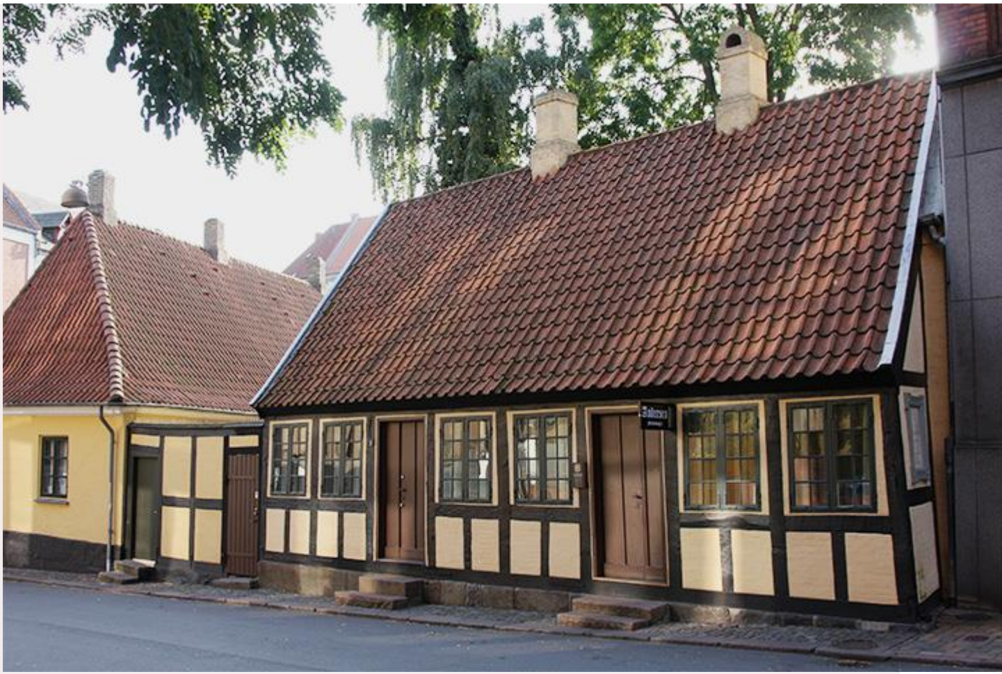
Дом, в котором вырос писатель