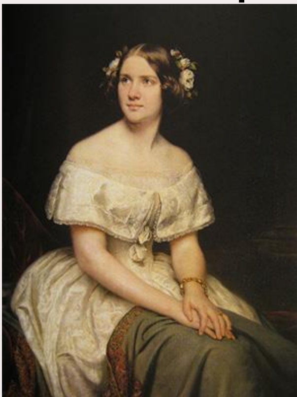
Певица Йенни Линд Фотография: фото «Брр...

какой ужас! На каждом дереве висело по три, по четыре принца, которые когда-то сватались за принцессу, но не сумели отгадать того, что она