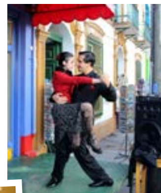
▲ BUENOS AIRES: Tango for to, god mat og rimelig shopping.