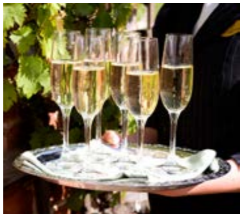
▲ FEIRING: Slottet Hindsgavl feirer Norges 200-årsjubileum.

Visste du at Norges selvstendighet ble avgjort i Danmark for 200 år siden? Det skjedde nemlig ikke på Eidsvold, men på Hindsgavl Slott på øya Fyn i Danmark. Her signerte kong Frederik 6. fredstraktaten mellom Norge og Danmark i 1814. 200 år senere kan du feire jubileet med et staselig slottsbesøk.