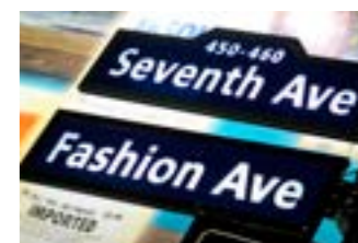
▲ NEW YORK: På shoppingtoppen med størst variasjon.