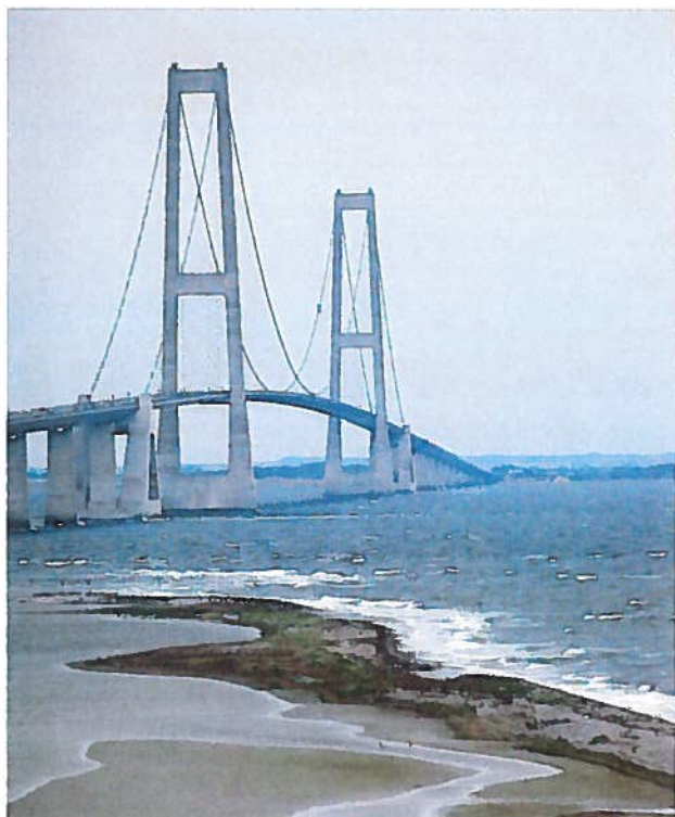
Hangbrug Grote Belt