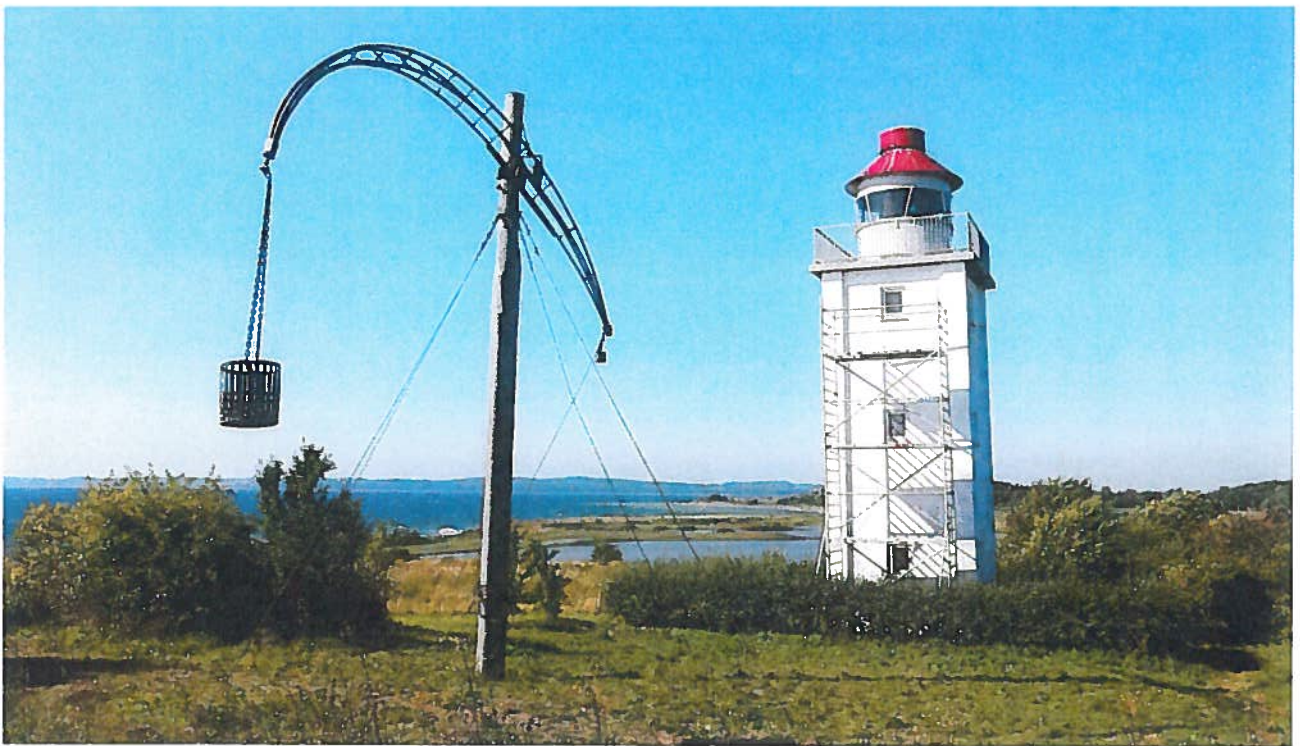
Knudshoved Fyr en wipvuur